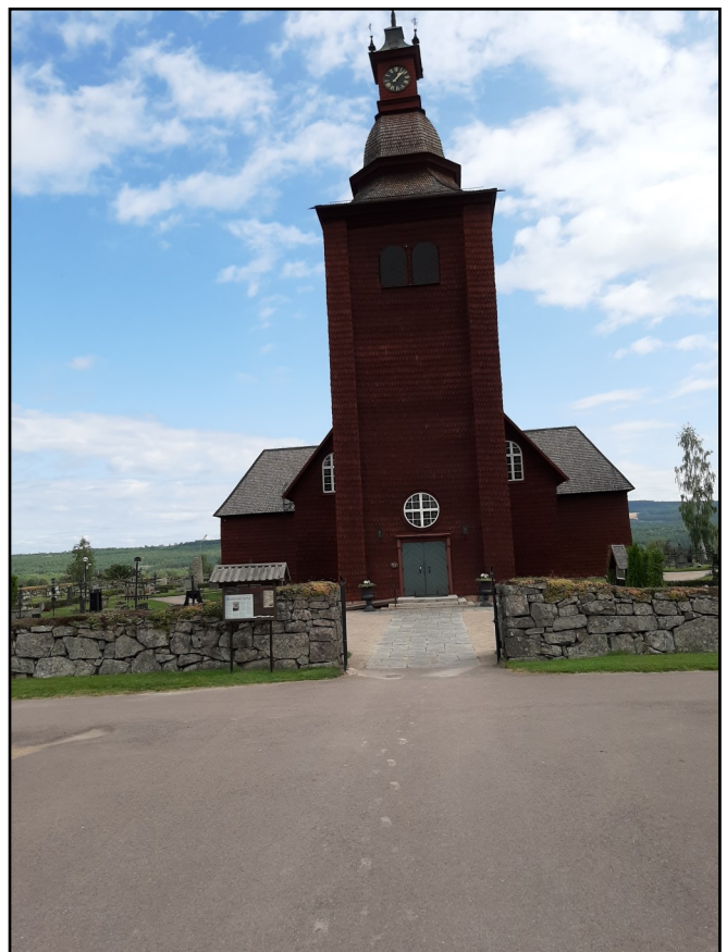
Ekshärads kyrka