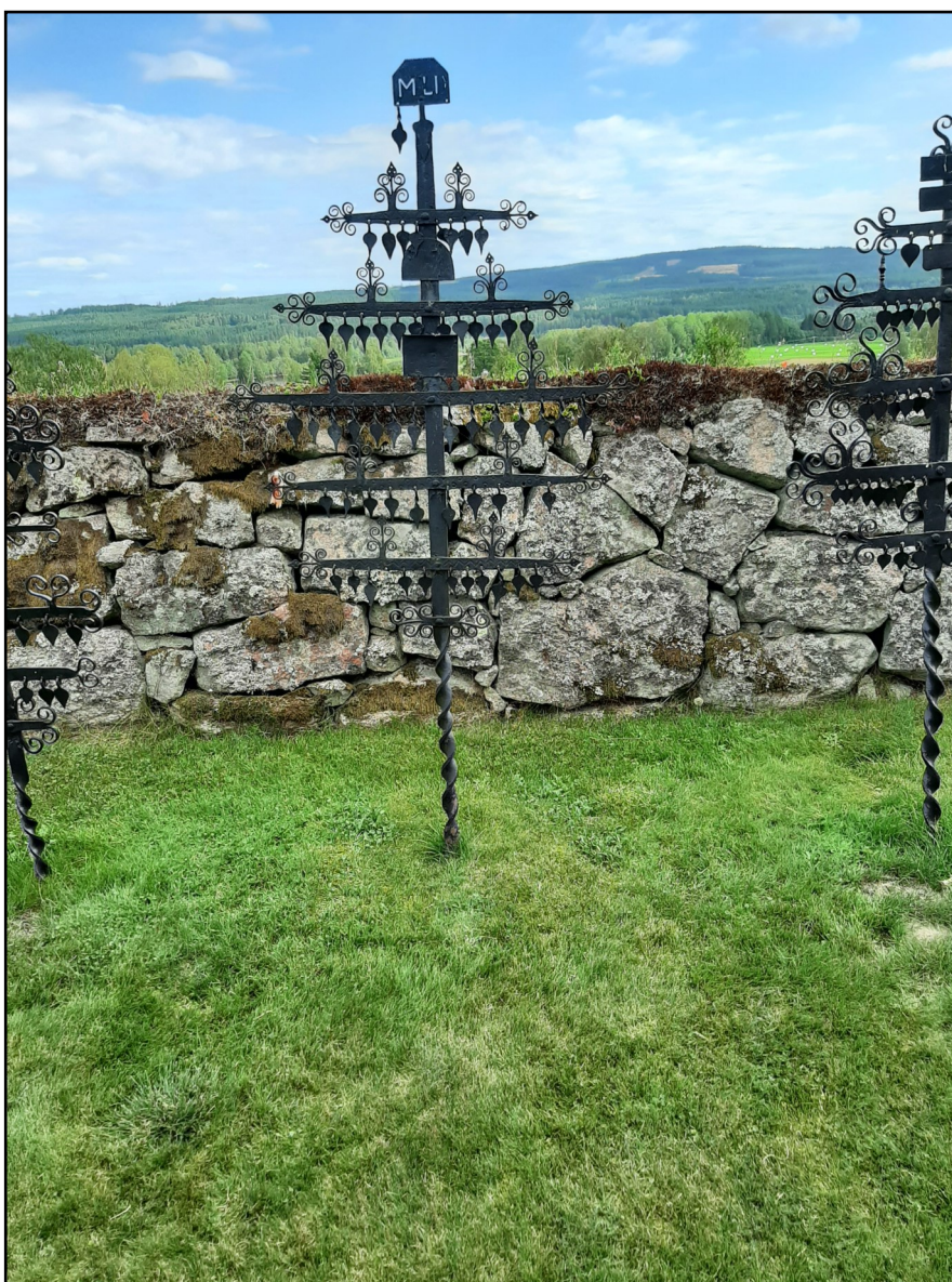
Järnkors på Ekshärads kyrkogård